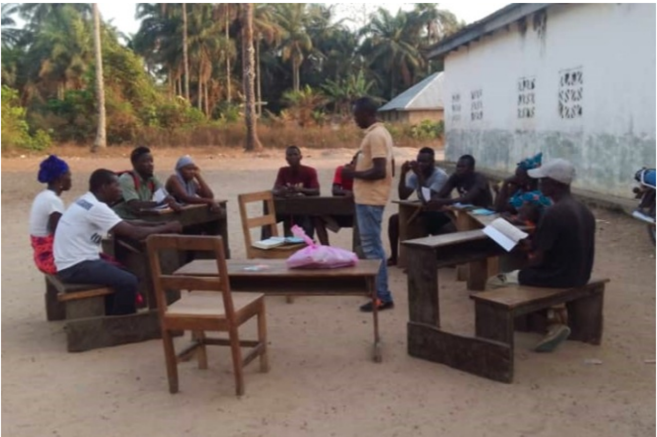
Kleingruppe in Sierra Leone

Im laufenden Jahr konnten 85'000 Christen mobilisiert werden, 468 Gemeinden waren aktiv. Insgesamt wurden 200'000 Traktate verteilt, 13'522 Menschen fanden zu Jesus und 553 Personen wurden getauft.