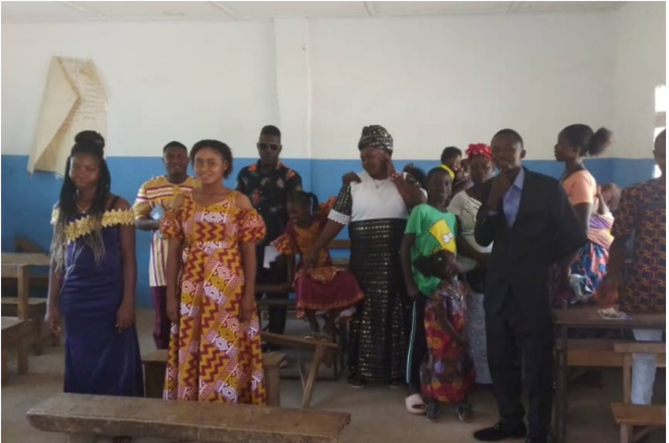
Gemeindemitglieder aus Sierra Leone